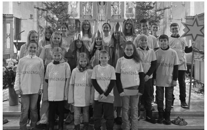
Die Sternsinger aus Inneringen:

Evangelische Verbundkirchengemeinde Gammertingen-Trochtelfingen www.gammertingen-trochtelfingen-evangelisch.de