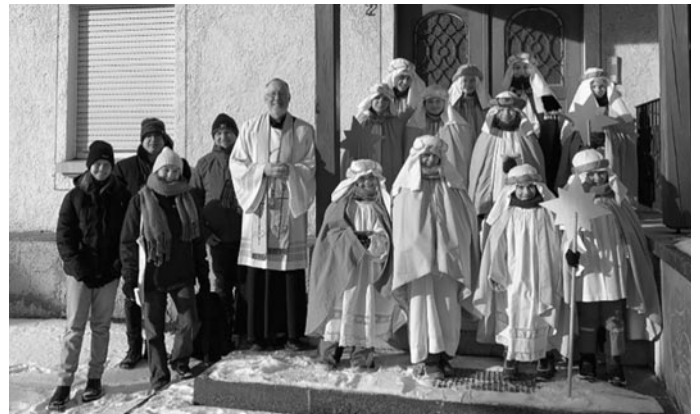
Die Sternsinger aus Hettingen:

Viele Kinder haben sich in Hettingen und Inneringen auf den Weg gemacht um für die Sternsingeraktion Spenden zu sammeln. Viel- len Dank an Euch liebe Kinder, sowie an die Helfer/ -innen und Betreuer /-innen.