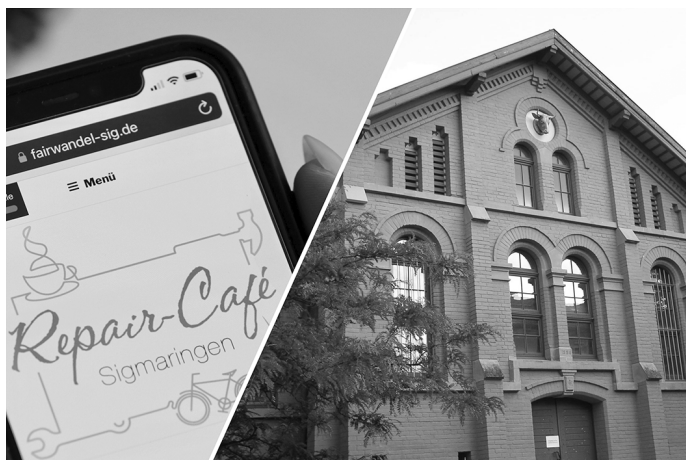
Um die Bedienung von Handys und anderen mobilen Endgeräten geht es beim Repair-Café „Frauen-Power – let’s go“ am 31. August im Alten Schlachthof in Sigmaringen.

wahl erfolgt über einen Test und ein Auswahlgespräch. Jährlich werden so bis zu 75 Studienplätze an Bewerberinnen und Bewerber vergeben, die sich im Gegenzug dazu verpflichten, nach dem Studium und der Facharztweiterbildung mindestens zehn Jahre als Hausärztin oder Hausarzt in einem unterversorgten oder von der Unterversorgung bedrohten Gebiet zu arbeiten.