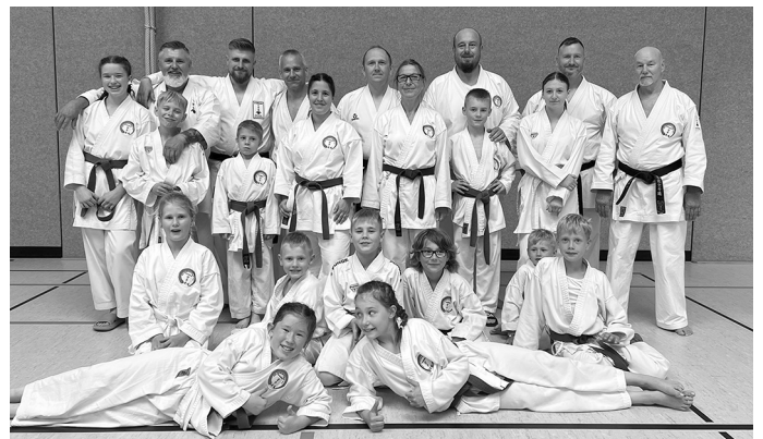
Auf dem Bild die teilnehmenden Gammertinger Karatekämpfer

In Heimsheim fand das diesjährige Koshinkan Sommer-Camp 2024 statt. Im Unterschied zu den wöchentlichen Trainingsstunden wurden hier über den ganzen Tag in verschiedenen Trainingshallen mit unterschiedlichen Trainern realistische Selbstverteidigung gelehrt. Ergänzt wurde das umfangreiche Programm mit der Anwendung der Katas – Scheinkampf - . Anstrengend – lehrreich – einfach ein toller Tag war auch dann das einhellige Fazit der Gammertinger Teilnehmer mit dem Wunsch auf Wiederholung. Dankeschön den Verantwortlichen und den Durchführenden.