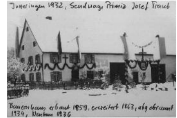
Das Elternhaus ist zur Primiz im Jahre 1932 prächtig geziert