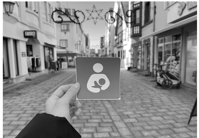
Ein spezieller Sticker kennzeichnet teilnehmende Orte im Landkreis Sigmaringen als still- und babyfreundlich.

Darüber hinaus gibt es eine Liste der Orte zum Download unter www.landkreis-sigmaringen.de/stillorte . Interessierte Geschäfte, Gastronomiebetriebe oder andere öffentliche Einrichtungen, die sich als stillfreundlicher Ort registrieren lassen möchten, können sich weiterhin per E-Mail an kgk@irasig.de oder telefonisch unter 07571 102-6423 melden.